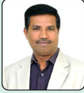
ఆచార్య కె. బి. చంద్రశేఖర్ , వైస్ ఛాన్సలర్, కృష్ణా యూనివర్సిటీ, మచిలీపట్నం, ఆంధ్రప్రదేశ్