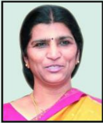
డా॥ నందమూరి లక్ష్మీ పార్వతి చైర్మన్, తెలుగు, సంస్కృత అకాడమి, ఆంధ్రప్రదేశ్